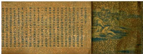
国宝 法華経(浅草寺経) 巻第一 平安時代 浅草寺蔵