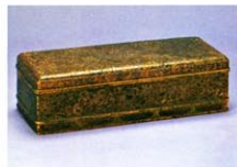
国宝 金銅宝相華文経箱 平安時代 延暦寺蔵