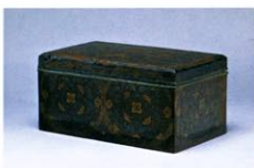
国宝 宝相華鈔経箱 平安時代 延暦寺蔵