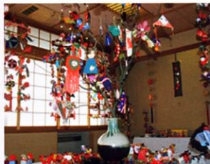
写真/信州上田 龍の会

また期間中「つり雛講習会」も行われますので、珍しいつるし飾りを是非ご覧ください。主催/全国つるし飾りサミット in 別所温泉実行委員会 026813812020