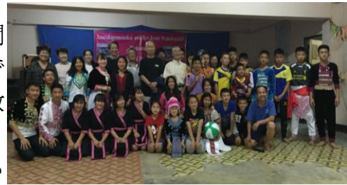
↑交流会後、それぞれの民族衣装を着たパヤオ学生寮の寮生たちと。

翌日寮生の家庭訪問をして解りました。寮から車に分乗して悪路の山道を約1時間半、山間に寄り添うように粗末な家が建っている、その中の一軒を「ここが私の家です」と中学生の寮生が案内してくれました。両親と5人の兄妹たち「この子以外に教育を受けさせる余裕はありません」と父親。つまり、この寮生は、家族の期待を否、村のそれを一身に背負って学んでいるといっても過言ではないのです。しかし、けっして気負うことはなく、寮での交流会で見せた明るさが印象的でした。日本の青少年と交流の機会がもてたら…。と思うのは私だけではないでしょう。